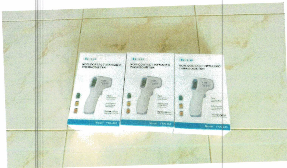
เทอร์โมมิเตอร์ชนิดยิงสีรยะ