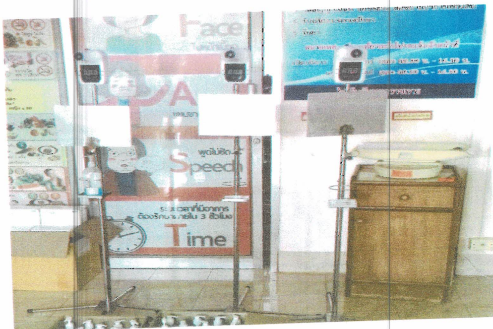
ที่กีดเจดล้งมือชนิดแบบเท้าเหยียบ พร้อมเครื่องวัดอุณหภูมิ