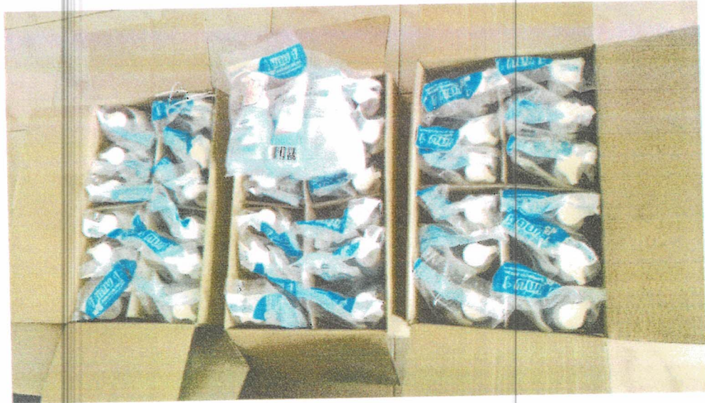
น้ำยาล้างมือ